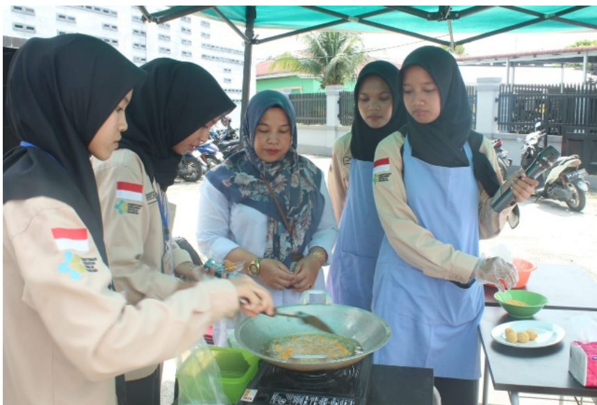
Gambar 4. Demo Masak

Dengan adanya kegiatan ini, diharapkan para ibu termotivasi untuk lebih kreatif dan konsisten dalam menyediakan bekal sehat demi tumbuh kembang anak yang optimal.