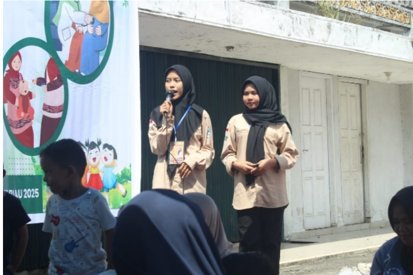
Gambar 2. Penyuluhan Gizi

Respon masyarakat terhadap kegiatan ini sangat positif. Para orang tua dan pengasuh antusias mengikuti sesi penyuluhan, aktif bertanya, dan berbagi pengalaman. Mereka mengaku mendapat inspirasi dan motivasi untuk mulai mengubah kebiasaan penyediaan bekal anak di rumah dan sekolah. Hal ini menunjukkan bahwa penyuluhan dengan media visual seperti infokus dapat menjadi metode efektif untuk meningkatkan kesadaran gizi di masyarakat.